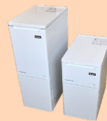
保冷式 計量米びつ